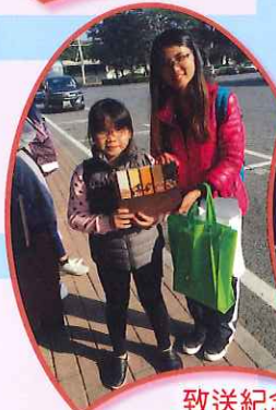
致送紀念品予導遊和領隊