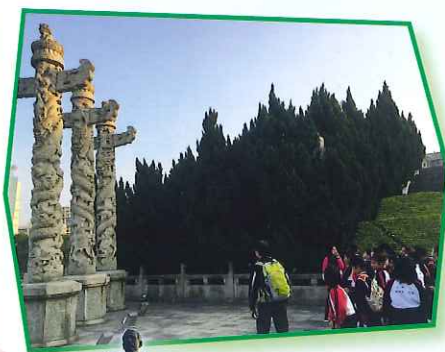
古人以華 表來指示 方向