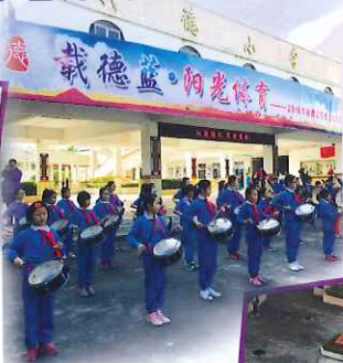
樂團列隊 歡迎我們