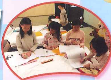
同學們在晚上努力地完成學習冊