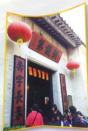
具當代特色的房屋