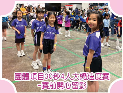
團體項目30秒4人大繩速度賽 -賽前開心留影

在過去三年，本校花式跳繩校隊積極參加不同類型的花式跳繩比賽，包括華永盃跳繩錦標賽、葵青區跳繩錦標賽、獅子盃全港跳繩挑戰賽、全港學界跳繩比賽等，學生吸收豐富的比賽經驗之餘，亦獲取優異的成績。在比賽過程中，學生除了享受跳繩的樂趣，自信心亦得到提升，由最初缺乏自信，到累積比賽經驗增加了，也懂得調整心態迎戰。最重要的是比賽增強了學生的團體合作精神，經過大大小小的比賽磨練，隊員之間的默契與信任日益增強，有助提升溝通與社交技巧。期望本校的花式跳繩在未來的比賽更創佳績，學生得益更多。