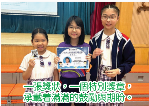
一張獎狀，一個特別獎章，承載着滿滿的鼓勵與期盼。