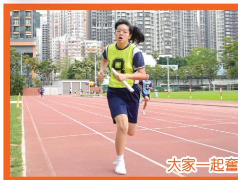
大家一起奮力向前衝