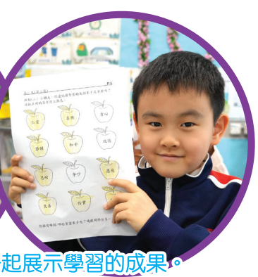
讓我們一起展示學習的成果。