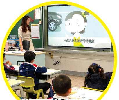
老師透過繪本教導我們要與別人和睦共處。