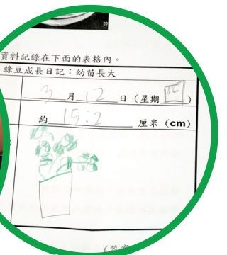
我們細心觀察綠豆的成長過程，並體驗到種植的樂趣。