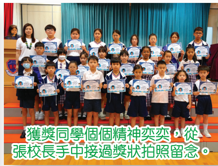
獲獎同學個個精神奕奕，從張校長手中接過獎狀拍照留念。