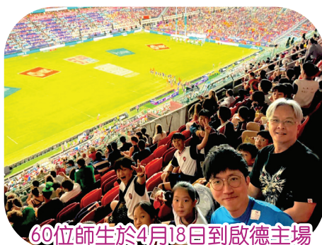
60位師生於4月18日到啟德主場館觀看欖球賽事。