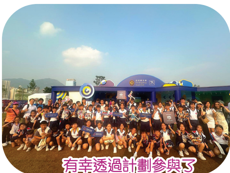
有幸透過計劃參與了 Hong Kong Sevens 這場體育盛事。