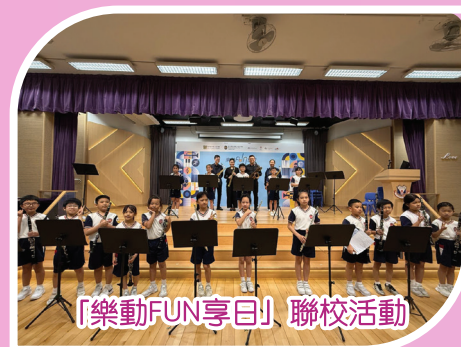
「樂動FUN享日」聯校活動