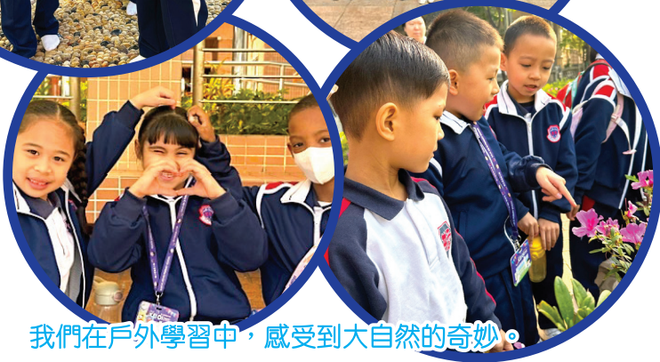
我們在戶外學習中，感受到大自然的奇妙。