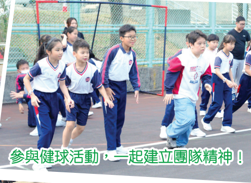
參與健球活動，一起建立團隊精神！