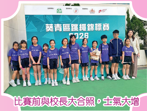
比賽前與校長大合照，士氣大增