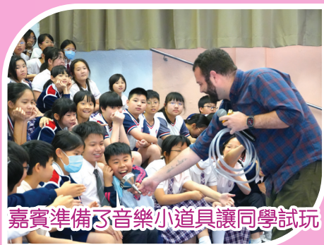
嘉賓準備了音樂小道具讓同學試玩