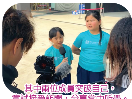
其中兩位成員突破自己，嘗試接受訪問，分享當中所學。