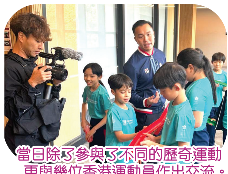
當日除了參與了不同的歷奇運動，更與幾位香港運動員作出交流。