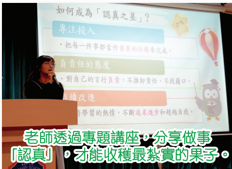
老師透過專題講座，分享做事「認真」，才能收穫最紮實的果子。