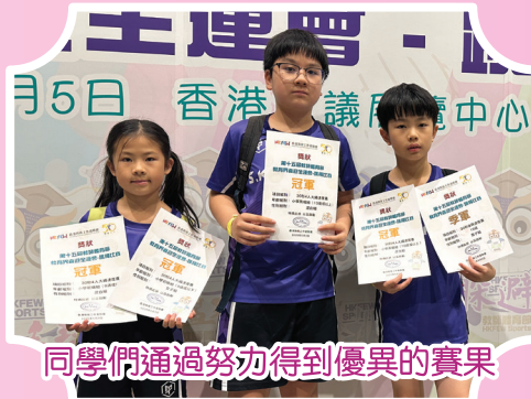
同學們通過努力得到優異的賽果