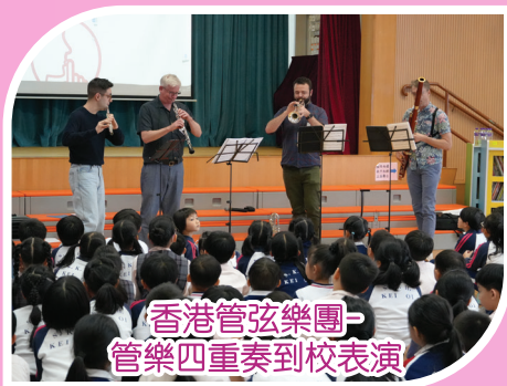
香港管弦樂團-管樂四重奏到校表演