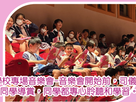
學校專場音樂會-音樂會開始前，司儀為同學導賞，同學都專心聆聽和學習。