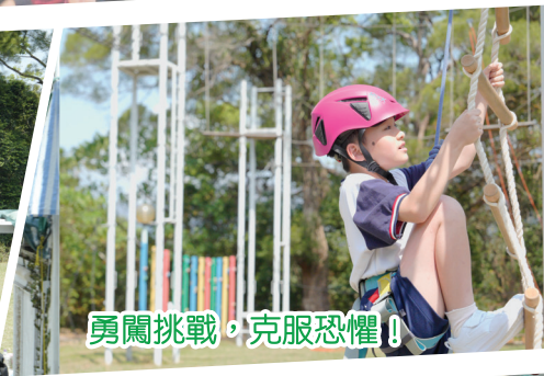
勇闖挑戰，克服恐懼！