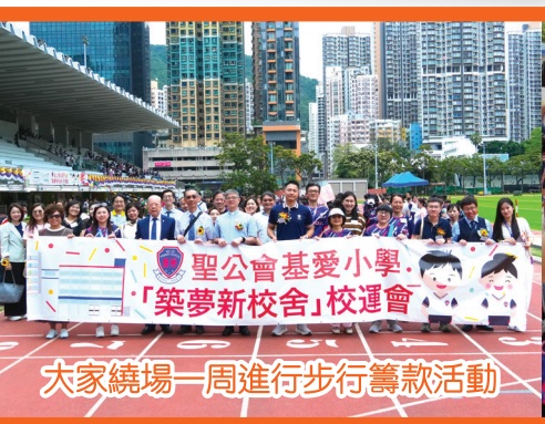
大家繞場一周進行步行籌款活動