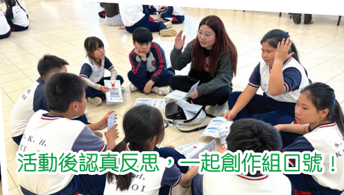
活動後認真反思，一起創作組回號！