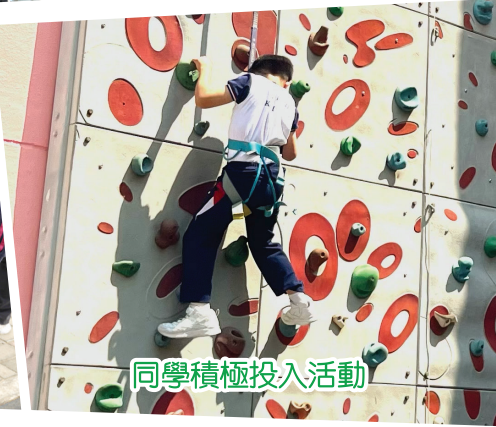
同學積極投入活動