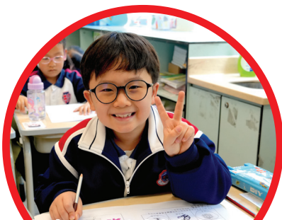
我們在學習活動中都很投入，並享受到學習的樂趣。