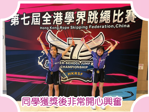
同學獲獎後非常開心興奮