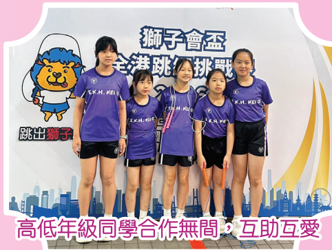
高低年級同學合作無間，互助互愛