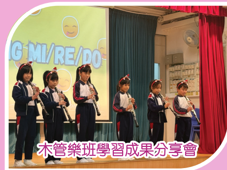
木管樂班學習成果分享會

本年度基愛同學在校外校內也有不少觀賞音樂會的機會，包括香港管弦樂團、香港青年口琴家李俊樂及管樂四重奏，樂器班同學也有不少演出，包括：木管樂班學習成果分享會及「樂動FUN享日」聯校活動。