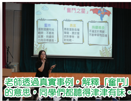
老師透過真實事例，解釋「奮鬥」的意思，同學們都聽得津津有味。