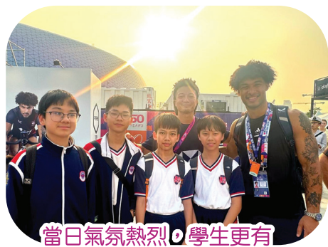
當日氣氛熱烈，學生更有機會與港隊成員合照。