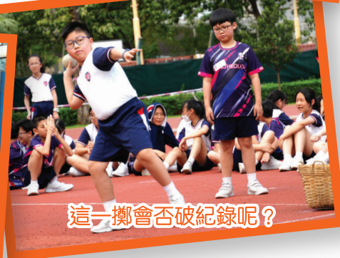
這一擲會否破紀錄呢？