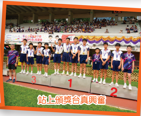
站上頒獎台真興奮