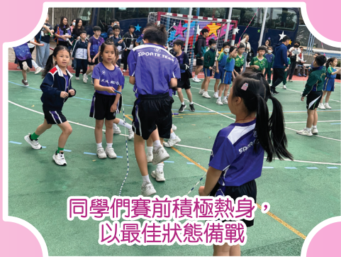
同學們賽前積極熱身， 以最佳狀態備戰