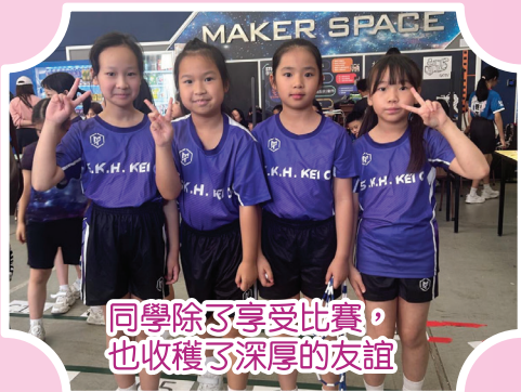
同學除了享受比賽， 也收穫了深厚的友誼

在過去三年，本校花式跳繩校隊積極參加不同類型的花式跳繩比賽，包括華永盃跳繩錦標賽、葵青區跳繩錦標賽、獅子盃全港跳繩挑戰賽、全港學界跳繩比賽等，學生吸收豐富的比賽經驗之餘，亦獲取優異的成績。在比賽過程中，學生除了享受跳繩的樂趣，自信心亦得到提升，由最初缺乏自信，到累積比賽經驗增加了，也懂得調整心態迎戰。最重要的是比賽增強了學生的團體合作精神，經過大大小小的比賽磨練，隊員之間的默契與信任日益增強，有助提升溝通與社交技巧。期望本校的花式跳繩在未來的比賽更創佳績，學生得益更多。