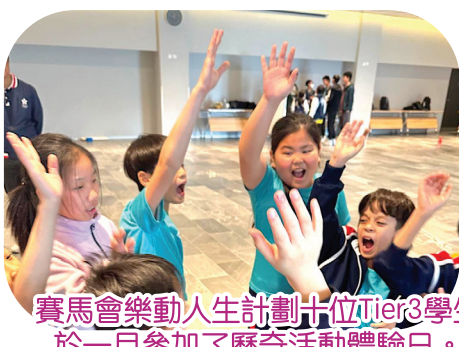
賽馬會樂動人生計劃十位Tier3學生於一月參加了歷奇活動體驗日。